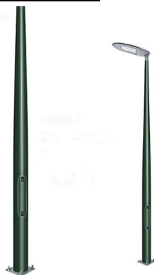
Ενδεικτική Εικόνα Ιστού

Ο συνθετικός πολυεστερικός ιστός FRP θα είναι ένας συνδυασμός πολυεστερικών ρητινών, υάλινων υφασμάτων και υάλινων ινών για τη δημιουργία ενός υλικού με παραμέτρους υψηλής αντοχής, κατάλληλο για την παραγωγή ιστών φωτισμού. Το σχήμα θα είναι κολουροκωνικό, με διάμετρο βάσης / κορυφής Φ150mm / Φ60mm και ύψους 3m. Η βάση του ιστού θα φέρει μεταλλική φλάντζα για την τοποθέτηση αγκυρίων. Ο ιστός θα πληροί τις απαιτήσεις του πρότυπου En 404-7.