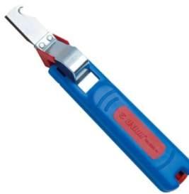
Ενδεικτική Εικόνα Απογυμνωτή

Υλικό: Πολυαμίδη • Προτερήματα: Δεν προκαλεί ζημιά στον εσωτερικό αγωγό χάρη στην απεριόριστη δυνατότητα προσαρμογής του βάθους κοπής. • Περιστρεφόμενο μαχαίρι: Γυρνάει αυτόματα από κυκλικό σε επίμηκες κόψιμο. • Χρήση: Ακριβής, γρήγορη και ασφαλής απογύμνωση όλων των κοινών στρογγυλών καλωδίων 4-28mm 2 .