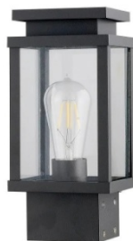
Ενδεικτική Εικόνα Φωτιστικού

Φωτιστικό φανάρι δαπέδου, 240V, Max60w, E27, IP33, 12.7x12.7x80cm, μαύρο Βαθμός στεγανότητας (IP): 33 • Τάση: 230V • Κάλυκας: E27 • Αριθμός Λαμπτήρων: 1 • Ισχύς ανά Λαμπτήρα (W): 60 • Ύψος (εκ): 27,9 • Μήκος (εκ): 12,7 • Πλάτος (εκ): 12,7 • Σχεδιασμός: Vintage / Αντικέ • Υλικό: Γυαλί • Υπόλοιπα Υλικά: Αλουμίνιο, Γυαλί • Πληροφορίες Λαμπτήρων: E27 1x60W • Χρώμα; Μαύρο