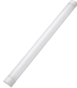
Ενδεικτική Εικόνα Φωτιστικού

Μικτό Βάρος Προϊόντος (kg): 0.320 • Ισχύ Watt: 15W/20W/24W • Watt/ Chip: 2.4W/Chip • Συχνότητα Λειτουργίας (Hz): 50/60Hz • Μάρκα Chip: Sanan • Ύψος Τοποθέτησης: 2-4mtr • Απόδοση σε Lumen (lm): 1800lm-2400lm-2880lm • Μέγεθος Chip: SMD2835 • Τύπος Σύνδεσης: Καλώδιο/Wire • Ύψος: 23mm Υλικό Κατασκευής Προϊόντος: Πλαστικό/Plastic • Χρωματική Απόδοση CRI (Ra): >80 • Μήκος: 900mm • Πλάτος: 75mm • Μήκος Καλωδίου: 500mm • Διατομή Καλωδίου: 2x0.75mm 2 • Ενεργειακή Κλάση: E • Τάση Τροφοδοσίας (V): 200-240V • Γωνία Δέσμης: 120° • Χωρίς "φλικάρισμα": Ναι/Yes • Διάρκεια Ζωής (h): 30000h • Μάρκα Τροφοδοτικού: Sanan • Χρόνος Έναυσης (sec): 1.0 sec • Γείωση Αντικειμένου: Όχι /No • Χρώμα Προϊόντος: Λευκό /White • Κλάση Μόνωσης: Class II • Περιλαμβάνεται Τροφοδοτικό: Ναι/Yes • Απόδοση σε Lumen/ Watt; 120lm/Watt • Θερμοκρασία Λειτουργίας °C: -20°C - +40°C • Θερμοκρασία Χρώματος (K): 3CCT (3000-4000-6500K) • Συντελεστής Κρούσης (IK): IK06 • Πιστοποιητικά: Ναι/Yes • Lumen/ Chip: 125-145lm/Chip • Ένδειξη CE: Ναι/Yes • Ένταση Ρεύματος (A): 132mA • Βαθμός Στεγανότητας (IP): IP40 • Καθαρό Βάρος Προϊόντος (kg): 0.246 • Συντελεστής Άεργου Ισχύος (PF): >0.70 • Κύκλοι Μεταγωγής (ON/ OFF): 15000 • Σύνολο Chip: 60pcs • Τύπος Led: SMD2835