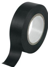
Ενδεικτική Εικόνα Μονωτικής Ταινίας

Η μονωτική ταινία θα είναι ιδιαίτερα προσαρμόσιμη, με καλή ευκαμψία για προστασία ηλεκτρολογικών συνδέσεων από υγρασία και μηχανική προστασία. Θα διαθέτει εγκρίσεις UL, CSA και VDE. Θα είναι σχεδιασμένη για κύρια ηλεκτρολογική μόνωση για όλες τις συνδέσεις καλωδίων και αγωγών μέχρι 600 V και 105 °C, με ελαστικό σώμα με ανθεκτική κόλλα - για προστασία ηλεκτρολογικών συνδέσεων από υγρασία και μηχανική προστασία με ελάχιστο όγκο. Θα παρέχει εξαιρετική προστασία από την τριβή, τα οξέα, τα αλκάλια και τη διάβρωση χαλκού. Θα είναι κατάλληλη για ψυχρό καιρό έως -18 °C, θα παραμένει εξαιρετικά προσαρμόσιμη και εύκαμπτη, χωρίς να γίνεται εύθραυστη. Διατηρεί υψηλό επίπεδο απόδοσης σε θερμοκρασίες περιβάλλοντος έως 105 °C. Χρώμα: μαύρη. Διαστάσεις: 19 mm x 20 m