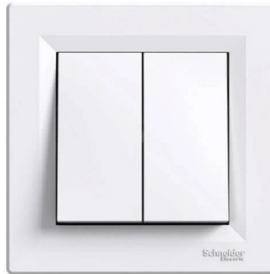
Ενδεικτική Εικόνα Διακόπτη

Αριθμός πλήκτρων: 2 • Βαθμός προστασίας (IP): IP31 • Διακόπτης μπουτόν: ΟΧΙ • Ελεύθερα αλογόνου: ΝΑΙ • Ένδειξη λειτουργίας: ΟΧΙ • Μέθοδος συναρμολόγησης: Μηχανισμός, μετώπη • Μέθοδος τοποθέτησης: Χωνευτός • Ονομαστική τάση: 250V • Ονομαστικό ρεύμα: 10A • Ποιότητα υλικών: Θερμοπλαστικό • Προστασία επιφάνειας: Ανεπεξέργαστα • Ρεύμα για λαμπτήρες φθορισμού: 10AX • Σύστημα καλωδίωσης: Κομιτατέρ • Τύπος στερέωσης: Με νύχι & βίδα • Υλικό: Πλαστικό • Φωτιζόμενος: ΟΧΙ • Χρώμα: Λευκός