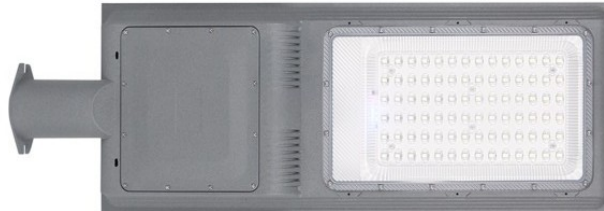
Ενδεικτική Εικόνα φωτιστικού

Τάση Τροφοδοσίας (V):3.2V DC • Ονομαστική Ισχύς (W):30W • Ένταση Ρεύματος (A):25000Ma • Συχνότητα Λειτουργίας (Hz):Όχι/No • Τύπος Led:SMD5050 • Θερμοκρασία Χρώματος (K):4000K • Απόδοση σε Lumen (lm):2600-2900lm • Lumen/ Chip:180Lm/chip • Watt/ Chip:1W/Chip • Σύνολο Chip:84pcs • Μέγεθος Chip:SMD5050 • Μάρκα Chip:AMTC • Μάρκα Τροφοδοτικού: Driverless • Περιλαμβάνεται Τροφοδοτικό:Όχι/No • Συντελεστής Άεργου Ισχύος (PF):Όχι/No • Χρωματική Απόδοση CRI (Ra):>70 • Διάρκεια Ζωής (h):30000h • Χρόνος Έναυσης (sec):0.1 sec • Κύκλοι Μεταγωγής (ON/ OFF):30000 • Ρύθμιση Έντασης:Ναι/Yes • Ενεργειακή Κλάση:G • Βαθμός Στεγανότητας (IP):IP66 • Συντελεστής Κρούσης (IK):IK04 • Θερμοκρασία Λειτουργίας °C:-25°C - +45°C • Γωνία Δέσμης:70°* 140° • Χρώμα Προϊόντος:Γκρι/Grey • Υλικό Κατασκευής Προϊόντος:Αλουμίνιο+PC/ Aluminium+PC • Καθαρό Βάρος Προϊόντος (kg):3.690 • Μεικτό Βάρος Προϊόντος (kg):4.200 • Ύψος :75mm • Πλάτος :255mm • Μήκος:740mm • Εγγύηση:3 Χρόνια/3 Years