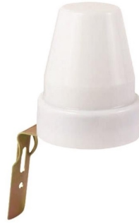
Ενδεικτική Εικόνα Φωτοκυτόταρου

Μεικτό Βάρος Προϊόντος (kg): 0.470 • Ισχύ Watt: Max 500W • Συχνότητα Λειτουργίας (Hz): 50/60Hz • Τύπος Σύνδεσης: Κλέμμα/ Terminal Block • Ύψος: 76.70mm • Υλικό Κατασκευής Προϊόντος: Πλαστικό (UV Proof)/Plastic (UV Proof) • Μήκος: 63mm • Τάση Τροφοδοσίας (V): 220-240V • Χρώμα Προϊόντος: Λευκό/White • Κλάση Μόνωσης: Κλάση II/Class II • Θερμοκρασία Λειτουργίας °C: -20°C -+40°C • Πιστοποιητικά: Ναι/ Yes • Ένδειξη CE: Ναι/ Yes • Ένταση Ρεύματος (A): 10A • Βαθμός Στεγανότητας (IP): IP44 • Καθαρό Βάρος Προϊόντος (kg): 0.396