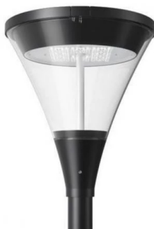
Ενδεικτική Εικόνα Φωτιστικού

Τάση Τροφοδοσίας (V): 100-277 V. • Ονομαστική Ισχύς (W): 18-30-45-60 W (μεταβαλλόμενη). • Ένταση Ρεύματος (A): 105 Ma. • Συχνότητα Λειτουργίας (Hz): 50/60 Hz. • Τύπος Led: SMD 3030. • Θερμοκρασία Χρώματος (K): 3CCT 3000-4000-5000 K (μεταβαλλόμενη). • Απόδοση σε Lumen (lm): 2610-4350-6525-8700 lm (μεταβαλλόμενη). • Απόδοση σε Lumen/ Watt: 145 Lm/Watt. Lumen/ Chip: 170 Lm/chip. Watt/ Chip: 1W/Chip. • Σύνολο Chip: 90 pcs. • Μέγεθος Chip: 3030. • Περιλαμβάνεται Τροφοδοτικό: Ναι. • Συντελεστής Άεργου Ισχύος (PF): >0.95. • Χρωματική Απόδοση CRI (Ra): >70. • Διάρκεια Ζωής (h): 54000 h. • Χρόνος Έναυσης (sec): 0.5 sec. • Κύκλοι Μεταγωγής (ON/OFF): 100000. • Ρύθμιση Έντασης: Όχι. • Ενεργειακή Κλάση: D. • Βαθμός Στεγανότητας (IP): IP66. • Συντελεστής Κρούσης (IK): IK09. • Θερμοκρασία Λειτουργίας °C: -30°C - +50°C. • Γωνία Δέσμης: 160°. • Χρώμα Προϊόντος: Μαύρο. • Υλικό Κατασκευής Προϊόντος: Αλουμίνιο & Πλαστικό. • Καθαρό Βάρος Προϊόντος: 4.60 kg (περίπου). • Μεικτό Βάρος Προϊόντος: 6,10 g (περίπου). • Ύψος (περίπου): 420 mm. • Διάμετρος (περίπου): Φ371 mm. • Εγγύηση: 5 Χρόνια. • Πιστοποιητικά: Ναι. • Ένδειξη CE: Ναι. • Ύψος Τοποθέτησης: 3-5m. • Κλάση Μόνωσης: Class I. • Τύπος Σύνδεσης: Καλώδιο. • Γείωση Αντικειμένου: Ναι. • Μήκος Καλωδίου: 1500 mm. • Διατομή Καλωδίου: 3x1 mm. • Οπή Σύνδεσης: Φ60 mm 2