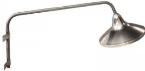
Ενδεικτική Εικόνα Φωτιστικού

Ολοκληρωμένο φωτιστικό με ανταυγαστήρα, ντουί και βραχίονα. Με ανταυγαστήρα από καθαρό αλουμίνιο, βαμμένος ηλεκτροστατικά. Τοποθετούνται κυρίως σε ξύλινες ή τσιμεντένιες κολώνες με τσέρκι. Τύπος: Επίτοιχο Τύπου ΔΕΗ Κομπλέ. • Μέτρηση Μήκους: 100cm. • Μέτρηση Διαμέτρου: 30cm. • Μέτρηση Ύψους: 35cm. • Τάση Τροφοδοσίας (V): 220-240V. • Ονομαστική Ισχύς (W): max 30W LED. • Συχνότητα Λειτουργίας (Hz): 50/60Hz • Ντουί: Μεγάλο Βίδωμα E27. • Στεγανότητα: IP23. • Συντελεστής Κρούσης (IK): IK10 • Θερμοκρασία Λειτουργίας °C: -20°C – +60°C. • Μεικτό Βάρος Προϊόντος (kg): 1,6 • Ύψος Τοποθέτησης: 6-8m. • Τύπος Σύνδεσης: Καλώδιο. • Γείωση Αντικειμένου: Ναι • Βασικό Υλικό: Ανταυγαστήρας Αλουμινίου, • Βραχίονας Γαλβανιζέ, • Ντουί Πορσελάνης • Χρώμα: Γκρι. • Πιστοποιητικά: ISO-9001, CE.