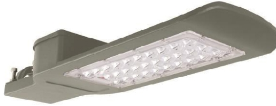
Ενδεικτική Εικόνα Φωτιστικού

Ονομαστική Ισχύς: 100W • Τάση τροφοδοσίας: 85-265V • Συχνότητα λειτουργίας: 50/60Hz • Ένταση ρεύματος: 450mA • Θερμοκρασία χρώματος: 4000K • Απόδοση σε Lumen: 12600lm • Lumen/Watt: 140lm/Watt • Lumen/Chip: 150lm/Chip • Σύνολο Chip: 90pcs • Watt/Chip: 1W/Chip • Μέγεθος Chip: 2835 • Περιλαμβάνεται τροφοδοτικό: Ενσωματωμένο στην πλακέτα • Τύπος LED: SMD2835 • Συντελεστής Άεργου Ισχύς (PF): >0,90 • Χρωματική Απόδοση CRI (Ra): >80 • Διάρκεια ζωής (h): 50000h • Βαθμός στεγανότητας: IP65 • Συντελεστής κρούσης: IK08 • Γωνία δέσμης: 120ο • Χρόνος έναυσης: 0,5 sec • Κύκλοι μεταγωγής (ON/OFF): 25000 • Θερμοκρασία λειτουργίας: -40 οC - +50 οC • Υλικό προϊόντος: Αλουμίνιο & PC • Χρώμα προϊόντος: Γκρι • Μήκος: 450mm περίπου • Πλάτος: 150mm περίπου • Ύψος: 62mm περίπου • Μεικτό βάρος: 1,150 Kg περίπου • Τύπος σύνδεσης: Καλώδιο • Γείωση αντικειμένου: Ναι • Διατομή καλωδίου: 3x075mm • Μήκος καλωδίου: 300mm • Οπή σύνδεσης: Φ60mm