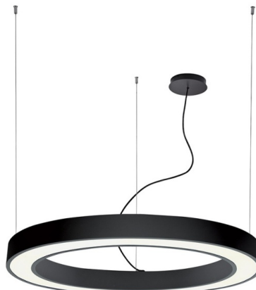
Ενδεικτική Εικόνα Φωτιστικού

Μαύρο κρεμαστό γραμμικό φωτιστικό κατασκευασμένο από αλουμίνιο. Στο κάτω μέρος του υπάρχει λευκή ακρυλική επιφάνεια που καλύπτει τον φωτισμό LED.