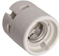
Ενδεικτική Εικόνα Ντουί

Μικτό Βάρος Προϊόντος (kg): 0.140 Ντουί Λαμπτήρα: E27 Ύψος: 46,5mm Υλικό Κατασκευής Προϊόντος: Πορσελάνη/Porcelain Διάμετρος: 43mm Τάση Τροφοδοσίας (V): 250V Χρώμα Προϊόντος: Λευκό/White Θερμοκρασία Λειτουργίας °C: -20°C - +60°C Πιστοποιητικά: Ναι/Yes Ένδειξη CE: Ναι/Yes Βαθμός Στεγανότητας (IP): IP20 Καθαρό Βάρος Προϊόντος (kg): 0.140