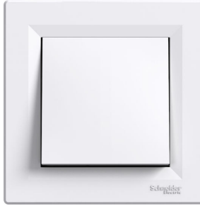
Ενδεικτική Εικόνα Διακόπτη

Διακόπτης με πλαίσιο, σε λευκό χρώμα, ο οποίος μπορεί να τοποθετηθεί με βίδες ή νύχια. Είναι κατασκευασμένος από πλαστικό, με μήκος και πλάτος 83mm, ενώ το βάθος του είναι 43mm.