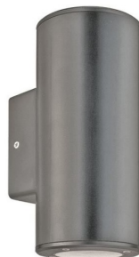
Ενδεικτική Εικόνα Απλίκας