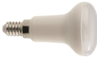
Ενδεικτική Εικόνα Λάμπας

Σειρά Προϊόντων: PLUS • Τάση Τροφοδοσίας: 220-240V • Ονομαστική Ισχύς: 8W • Θερμοκρασία Χρώματος: 4000K • Συχνότητα Λειτουργίας: 50 • Ένταση Ρεύματος: 44mA • Απόδοση σε Lumen: 640lm • Βαθμός Στεγανότητας: IP20 • Συντελεστής Άεργου Ισχύος: >0.55 • Χρωματική Απόδοση CRI: >80 • Διάρκεια Ζωής: 25000h • Θερμοκρασία Λειτουργίας: -30°C - +45°C • Ενεργειακή Κλάση: A+ • Ενεργειακή κλάση: G • Ντουί Λαμπτήρα: E14 • Τύπος LED: SMD2835 • Σχήμα Λαμπτήρα: R50 • Κύκλοι Μεταγωγής: 25000 • Ρύθμιση Έντασης: όχι • Χρόνος Έναυσης: 0.5 sec • Υδράργυρος: 0.00% • Γωνία Δέσμης: 120° • Διάμετρος: 50mm • Ύψος: 86mm • Υλικό Προϊόντος: πλαστικό με ψύκτρα αλουμινίου • Χρώμα Καλύμματος: frost • Τεμάχια ανά συσκευασία: 1 • Χρόνια Εγγύηση: 2 Χρόνια • Πιστοποιητικά: ναι • Ένδειξη CE: ναι