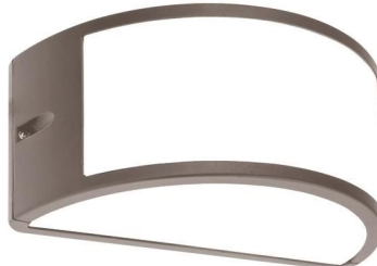
Ενδεικτική Εικόνα Απλίκας

Μεικτό Βάρος Προϊόντος (kg): 0,600 • Ισχύ Watt: Max 15W • Συχνότητα Λειτουργίας: (Hz) 50/60Hz • Ντουί Λαμπτήρα: E27 • Τύπος Σύνδεσης: Κλέμα/Terminal Block • Ύψος: 121mm • Υλικό Κατασκευής Προϊόντος: Αλουμίνιο+Πλαστικό/Aluminium+Plastic • Μήκος: 220mm • Πλάτος: 108mm • Τάση Τροφοδοσίας (V): 220-240V • Γείωση Αντικειμένου: Ναι/Yes • Χρώμα Προϊόντος: Γκρι/Grey • Θερμοκρασία Λειτουργίας °C: -25°C - +45°C • Συντελεστής Κρούσης (IK): IK07 • Πιστοποιητικά: Ναι/Yes • Κλάση: Class I • Ένδειξη CE: Ναι/Yes • Βαθμός Στεγανότητας (IP): IP54 • Καθαρό Βάρος Προϊόντος (kg): 0.500