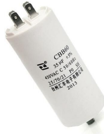
Ενδεικτική Εικόνα πυκνωτή

ΠΥΚΝΩΤΗΣ ΣΥΝΕΧΟΥΣ ΛΕΙΤΟΥΡΓΙΑΣ 60μF MKA60