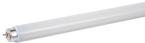
Ενδεικτική Εικόνα Λαμπτήρα

Τάση τροφοδοσίας: 220-240V, • Ονομαστική ισχύς: 18W, • Θερμοκρασία χρώματος: 6500K, • Συχνότητα λειτουργίας: 50/60Hz, • Απόδοση σε Lumen: 960lm, • Διάρκεια ζωής: 12000h, • Θερμοκρασία λειτουργίας: -30 - +45 ο C, • Ντουί λαμπτήρα: G13, • Σχήμα λαμπτήρα: T8, • Διάμετρος: 26mm, • Ύψος: 1200mm