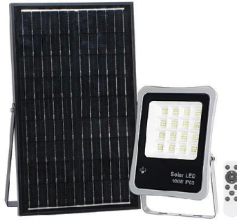
Ενδεικτική Εικόνα Προβολέα

Τάση τροφοδοσίας: 5V DC • Ονομαστική ισχύς: 100W • Θερμοκρασία χρώματος: 4000K • Απόδοση σε Lumen: 5500lm • Μέγεθος Chip: 2835 • Περιλαμβάνεται τροφοδοτικό: Ναι • Τύπος LED: SMD2835 • Χρωματική απόδοση CRI (Ra): >80 • Διάρκεια Ζωής: 30000h • Βαθμός στεγανότητας: IP65 • Συντελεστής κρούσης: IK07 • Γωνία δέσμης: 120ο • Χρόνος έναυσης: 0,50sec • Κύκλοι μεταγωγής (ON/OFF): 15000 • Θερμοκρασία λειτουργίας: -20 οC - +50 οC • Υλικό προϊόντος: Αλουμίνιο & γυαλί • Χρώμα προϊόντος: Dark Grey/Γραφίτης • Μήκος: 210mm περίπου • Πλάτος: 270mm περίπου • Ύψος: 43mm περίπου • Μεικτό βάρος 20,00 Kg • Διατομή καλωδίου: 2x1mm • Μήκος καλωδίου: 2m • Αισθητήρας μέρας/νύχτας: Ναι • Τηλεχειριστήριο: Ναι • Χρόνος φόρτισης μπαταρίας: 5-6h • Χρόνος αποφόρτισης μπαταρίας: 10-12h • Τύπος μπαταρίας: Lithium 3.2V 15000mAh