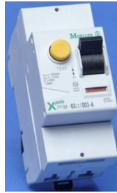
Ενδεικτική Εικόνα ρελέ

Αριθμός πόλων: 2 • Μέγιστο ρεύμα: 63A • Ρεύμα Διαρροής: 0,03mA • Τύπος εγκατάστασης: ράγα DIN • Διαφορικός τύπος ρεύματος: A • Αντοχή σε βραχυκύκλωμα (I cw ): 10kA • Αντοχή σε ρεύμα υπέρτασης: 0,25kA • Συχνότητα: 50 Hz • Επιπρόσθετες δυνατότητες: Ναι • Κατηγορία προστασίας (IP): IP20 • Πλάτος σε μονάδες διαίρεσης: 2 • Συνολικό βάθος: 60mm