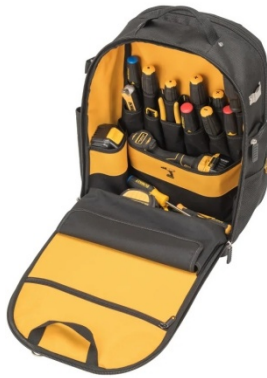
Ενδεικτική Εικόνα Τσάντας

Κατασκευασμένο με συνδυασμό σκληρού εξωτερικού υφάσματος 1200 denier και επένδυσης 600 denier για μέγιστη προστασία των πολύτιμων αντικειμένων, Ενισχυμένη βάση ανθεκτική στο νερό για μέγιστη προστασία από πιθανές καιρικές συνθήκες και φθορά, Το σύστημα ασφαλούς αποθήκευσης οργανώνει και διατηρεί τα εργαλεία σε μια θέση με εύκολη πρόσβαση, Χωρητικότητα 40lt, Πλάτος 21mm, Ύψος 48mm.