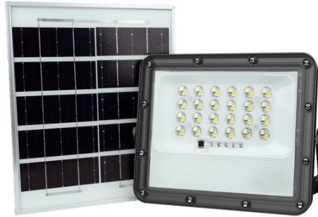
Ενδεικτική Εικόνα Προβολέα

Μικτό Βάρος Προϊόντος (kg) 1.340 • Ισχύ Watt 4W • Watt/ Chip 0.5W/Chip • Τύπος Μπαταρίας Lithium iron phosphate 3.2V 5AH • Ρύθμιση Έντασης Ναι • Μάρκα Chip Sanan • Ύψος Τοποθέτησης 2-3mtr • Απόσταση Ανίχνευσης 8m for the remote control distance • Απόδοση σε Lumen (lm) 520lm • Μέγεθος Chip SMD2835 • Τύπος Σύνδεσης Καλώδιο/Wire • Ύψος 45mm • Υλικό Κατασκευής Προϊόντος Αλουμίνιο-Πλαστικό/ Aluminium-Plastic • Χωρητικότητα Μπαταρίας 3.2V 5AH • Εγγύηση 3 Χρόνια • Πληροφορίες Προϊόντων Solar Panel Size:180*220mm • Χρόνος Φόρτισης Μπαταρίας 5H • Χρωματική Απόδοση CRI (Ra) >70 • Μήκος 158mm • Πλάτος 171mm • Μήκος Καλωδίου 250cm • Εφεδρεία Μπαταρίας (Χρόνος Αποφόρτισης) 8-Include • Remote control/Συμπεριλάβ τηλεχειριστήριο(Dims149x40x21mm) • Διατομή Καλωδίου 2x0.5MM 2 • Τάση Τροφοδοσίας (V) 3.2V • Γωνία Δέσμης 90° • Χωρίς "φλικάρισμα" Ναι/Yes • Διάρκεια Ζωής (h) 30000h • Χρόνος Έναυσης (sec) 0.5 sec • Χρώμα Προϊόντος Μαύρο/Black • Κλάση Μόνωσης Class III • Απόδοση σε Lumen/Watt 130lm/Watt • Θερμοκρασία Λειτουργίας °C -5°C - +50°C • Θερμοκρασία Χρώματος (K) 3CCT (3000-4000-6000K) • Συντελεστής Κρούσης (IK) IK06 • Lumen/ Chip 13.8lm/chip • Ένδειξη CE Ναι/Yes • Ένταση Ρεύματος (A) 118mA • Βαθμός Στεγανότητας (IP) IP66 • Καθαρό Βάρος Προϊόντος (kg) 1.060 • Κύκλοι Μεταγωγής (ON/ OFF) 15000 • Σύνολο Chip 48PCS • Τύπος Led SMD2835