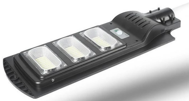
Ενδεικτική Εικόνα φωτιστικού