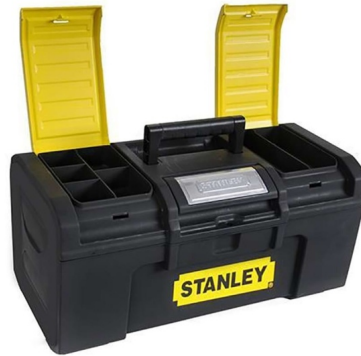
Ενδεικτική Εικόνα Εργαλειοθήκης

Εργαλειοθήκη Πλαστική Μαύρη με 1 Πάτο, 2 Ταμπακιέρες και Αυτόματο Κλείστρο Stanley. Με εύκολο άνοιγμα κουμπωμάτων με το ένα χέρι. Με αφαιρούμενο δίσκο. Με ενσωματωμένες ταμπακιέρες στο καπάκι. Διαστάσεων 48,6 x 26,6 x 23,6 cm. Αδιάβροχη. Βάρος: 2 kg