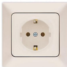
Ενδεικτική Εικόνα Πρίζας

Τάση Τροφοδοσίας (V) : 220-240V • Ονομαστική Ισχύς (W) : 3680W • Ένταση Ρεύματος (A) : 16A • Βαθμός Στεγανότητας (IP) : IP20 • Θερμοκρασία Λειτουργίας °C : -20°C - +40°C • Χρώμα Προϊόντος : Λευκό • Υλικό Κατασκευής Προϊόντος : Πλαστικό-ABS/Plastic-ABS • Καθαρό Βάρος Προϊόντος (kg) : 0,083 • Μεικτό Βάρος Προϊόντος (kg) : 0,083 • Ύψος : 41mm • Πλάτος : 82mm • Μήκος : 82mm • Πιστοποιητικά : Ναι/Yes • Ένδειξη CE : Ναι/Yes • Τρόπος τοποθέτησης : Screws • Αριθμός Σούκο : 1 • Πληροφορίες Προϊόντων : Χωνευτός / Recessed