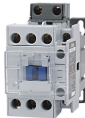
Ενδεικτική Εικόνα Ρελέ

Ισχύς (KW): 415V:7,5KW • Ένταση (A): (AC3/AC1):18 / 40A • Επαφή:1+1 • Τάση πηνίου: 230V AC • Τύπος:UKC1-18