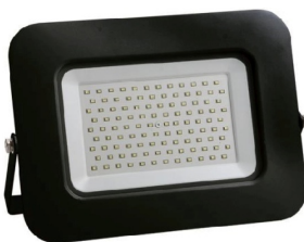
Ενδεικτική Εικόνα Προβολέα

Όνομαστική Ισχύς: 100W • Τάση τροφοδοσίας: 220-240V • Συχνότητα λειτουργίας: 50/60Hz • Ένταση ρεύματος: 500mA • Θερμοκρασία χρώματος: 4000K • Απόδοση σε Lumen: 11000lm • Lumen/Watt: 110lm/Watt • Lumen/Chip: 130lm/Chip • Σύνολο Chip: 108pcs • Watt/Chip: 1W/Chip • Μέγεθος Chip: 2835 • Περιλαμβάνεται τροφοδοτικό: Ενσωματωμένο στην πλακέτα • Τύπος LED: SMD2835 • Συντελεστής Άεργου Ισχύς (PF): >0,90 • Χρωματική Απόδοση CRI (Ra): >80 • Διάρκεια ζωής (h): 30000h • Βαθμός στεγανότητας: IP65 • Συντελεστής κρούσης: IK07 • Γωνία δέσμης: 100ο • Χρόνος έναυσης: 0,5 sec • Κύκλοι μεταγωγής (ON/OFF): 25000 • Θερμοκρασία λειτουργίας: -40 οC - +50 οC • Υλικό προϊόντος: Αλουμίνιο και γυαλί • Χρώμα προϊόντος: Μαύρο • Μήκος: 316mm περίπου • Πλάτος: 245mm περίπου • Ύψος: 33mm περίπου • Μεικτό βάρος: 1,80 Kg περίπου • Τύπος σύνδεσης: Καλώδιο • Γείωση αντικειμένου: Ναι • Διατομή καλωδίου: 3x1mm • Μήκος καλωδίου: 300mm