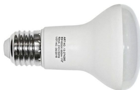
Ενδεικτική Εικόνα Λάμπας

Σειρά Προϊόντων: PLUS • Τάση Τροφοδοσίας: 220-240V • Ονομαστική Ισχύς: 8W • Θερμοκρασία Χρώματος: 4000K • Συχνότητα Λειτουργίας: 50 • Ένταση Ρεύματος: 44mA • Απόδοση σε Lumen: 640lm • Βαθμός Στεγανότητας: IP20 • Συντελεστής Άεργου Ισχύος: >0.55 • Χρωματική Απόδοση CRI: >80 • Διάρκεια Ζωής: 25000h • Θερμοκρασία Λειτουργίας: -30°C - +45°C • Ενεργειακή Κλάση: A+ • Ενεργειακή κλάση: G • Ντουί Λαμπτήρα: E27 • Τύπος LED: SMD2835 • Σχήμα Λαμπτήρα: R63 • Κύκλοι Μεταγωγής: 25000 • Ρύθμιση Έντασης: όχι • Χρόνος Έναυσης: 0.5 sec • Υδράργυρος: 0.00% • Γωνία Δέσμης: 120° • Διάμετρος: 50mm • Ύψος: 86mm • Υλικό Προϊόντος: πλαστικό με ψύκτρα αλουμινίου • Χρώμα Καλύμματος: frost • Τεμάχια ανά συσκευασία: 1 • Χρόνια Εγγύηση: 2 Χρόνια • Πιστοποιητικά: ναι • Ένδειξη CE: ναι