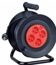
Ενδεικτική Εικόνα Μπαλαντέζας