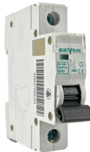
Ενδεικτική Εικόνα Ασφάλειας

Ονομαστικό ρεύμα(A): 63A • Αριθμός πόλων: 1 • Ικανότητα διακοπής: 6kA • Καμπύλη: B • Φάσεις: 1 φάση