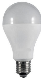
Ενδεικτική Εικόνα Λάμπας

Λαμπτήρας Led ισχύος έως 14W, • κάλυκας E27, • κατάλληλος για χρήση σε εξωτερικούς χώρους, • θα έχει: βαθμό στεγανότητας IP44 τουλάχιστον, • θερμοκρασία χρώματος 4000 K. • Η διάρκεια ζωής θα είναι 25.000 ώρες, • φωτεινή ροή \geq 1.500\text{lm} , • γωνία δέσμης 200ο περίπου, • δείκτης χρωματικής απόδοσης \geq 80 , • ενεργειακή κλάση A+. • Τάση 180-265V. • Μέγιστες διαστάσεις : Ύψος \leq 130\text{mm} , πλάτος \leq 70\text{mm} . • Εγγύηση: 3 έτη.