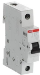
Ενδεικτική Εικόνα ασφάλειας

Κατασκευαστής: ABB • MPN: 70353 • Ικανότητα Διακοπής (A): 3KA • Βαθμός Στεγανότητας (IP): 20 • Είδος: Αυτόματη ασφάλεια • Πόλοι: 1 • Καμπύλη: C • Υλικό: Πλαστικό • Οικογένεια: SH200T • Τάση Λειτουργίας (V): 230V • Φάσεις: 1 • Ένταση (A): 10 / 16 / 20