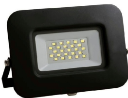
Ενδεικτική Εικόνα Προβολέα

Όνομαστική Ισχύς: 20W • Τάση τροφοδοσίας: 220-240V • Συχνότητα λειτουργίας: 50/60Hz • Ένταση ρεύματος: 100mA • Θερμοκρασία χρώματος: 4000K • Απόδοση σε Lumen: 2200lm • Lumen/Watt: 110lm/Watt • Lumen/Chip: 130lm/Chip • Σύνολο Chip: 25pcs • Watt/Chip: 1W/Chip • Μέγεθος Chip: 2835 • Περιλαμβάνεται τροφοδοτικό: Ενσωματωμένο στην πλακέτα • Τύπος LED: SMD2835 • Συντελεστής Άεργου Ισχύς (PF): >0,90 • Χρωματική Απόδοση CRI (Ra): >80 • Διάρκεια ζωής (h): 30000h • Βαθμός στεγανότητας: IP65 • Συντελεστής κρούσης: IK06 • Γωνία δέσμης: 100ο • Χρόνος έναυσης: 0,5 sec • Κύκλοι μεταγωγής (ON/OFF): 25000 • Θερμοκρασία λειτουργίας: -40 οC - +50 οC • Υλικό προϊόντος: Αλουμίνιο και γυαλί • Χρώμα προϊόντος: Μαύρο • Μήκος: 162mm περίπου • Πλάτος: 136mm περίπου • Ύψος: 24mm περίπου • Μεικτό βάρος: 0,35 Kg περίπου • Τύπος σύνδεσης: Καλώδιο • Γείωση αντικειμένου: Ναι • Διατομή καλωδίου: 3x1mm • Μήκος καλωδίου: 300mm