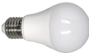
Ενδεικτική Εικόνα Λάμπας

Τάση Τροφοδοσίας (V): 175-250V. • Ονομαστική Ισχύς (W): 30W. • Ένταση Ρεύματος (A): 45mA. • Συχνότητα Λειτουργίας (Hz): 50/60Hz. • Ντουί Λαμπτήρα: E27. • Σχήμα Λαμπτήρα: A60. • Θερμοκρασία Χρώματος (K): 4000K. • Απόδοση σε Lumen (lm): 480lm. • Χρωματική Απόδοση CRI (Ra): >80. • Διάρκεια Ζωής (h): 25000h. • Χρόνος Έναυσης (sec): 0.5 sec. • Κύκλοι Μεταγωγής (ON/ OFF): 25000. • Ρύθμιση Έντασης: Όχι. • Βαθμός Στεγανότητας (IP): IP20. • Θερμοκρασία Λειτουργίας °C: -30°C - +45°C. • Γωνία Δέσμης: 300°. • Χρώμα Καλύμματος: Γάλακτος/Frost. • Υλικό Κατασκευής Προϊόντος: Πλαστικό με Ψύκτρα Αλουμινίου. • Μεικτό Βάρος Προϊόντος (kg): 0.035. • Ύψος : 107mm. Πιστοποιητικά: Ναι. • Ένδειξη CE: Ναι